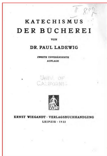
Okładka Katechismus der Biicherei , Leipzig 1922